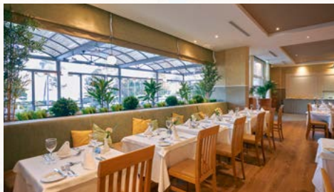
Das Restaurant des Hotels