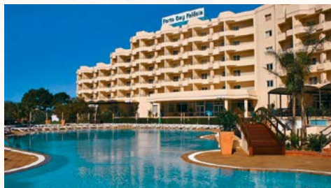
Das Hotel PortoBay Falésia

Einzigartig ist die Lage des Hotels über den Klippen - weit reicht der Blick auf den 5,5 km langen Strand Praia da Falésia. Zum Ort Olhos d'Água fährt man ca. 5 Minuten, nach Albufeira sind es etwa 8 km. Das Hotel befindet sich in der Nähe einer Einkaufszone. Die Transferzeit vom/zum Flughafen beträgt ca. 1 Stunde.