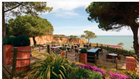
Die Lounge mit Blick aufs Meer

Tai Chi Forum Deutschland, Bahnhofstr.39-41 · 56346 St. Goarshausen Tel.: 0160-944 590 88 · www.tai-chi.de · vjung@tai-chi.de