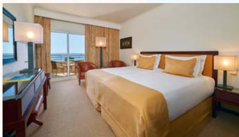
Standard-Zimmer mit Meerblick